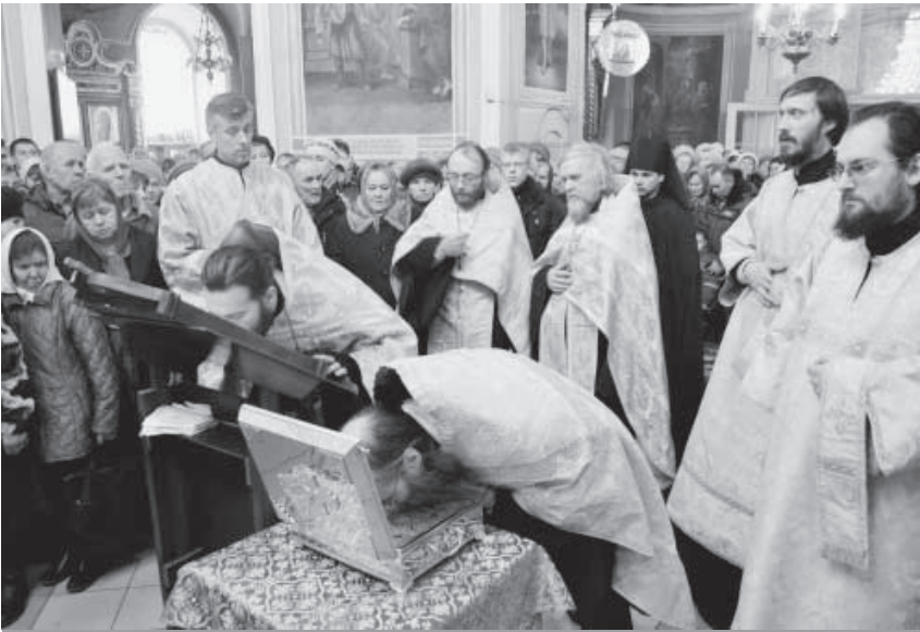
С 24 по 30 ноября ковчег с мощами блаженной Матроны пребывал в Успенском кафедральном соборе Яранска. В декабре его встречают другие храмы Епархии

— Обычно целование мощей происходит после молебных пений и чтения Акафиста. Как должно во время этого моления вести себя христианину?